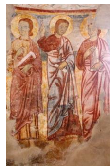
Oratorio San Leonardo di Borgomanero