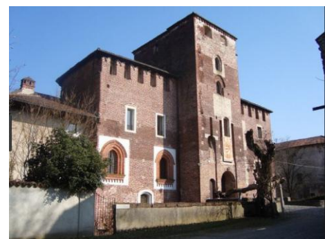
Castello di Caltignaga